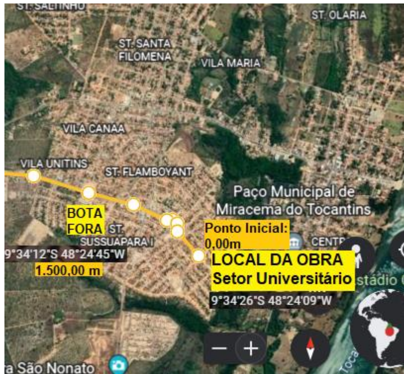
Imagem 02: Localização do local de dispensação dos resíduos – BOTA FORA e Jazida

O local de bota fora escolhido fica atrás do Hospital Estadual da cidade de Miracema do Tocantins – TO, conforme localização demonstrada na imagem 02.