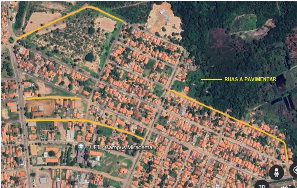
Imagem 01: Localização do Setor Universitário

Latitude: 9°34'10"S , Longitude: 48°24'12"W